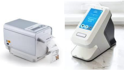
Medicijndispenser met check op afstand