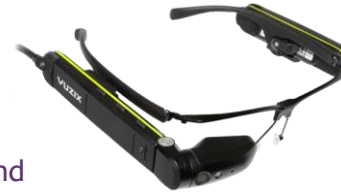
Meekijken op afstand door smartglass