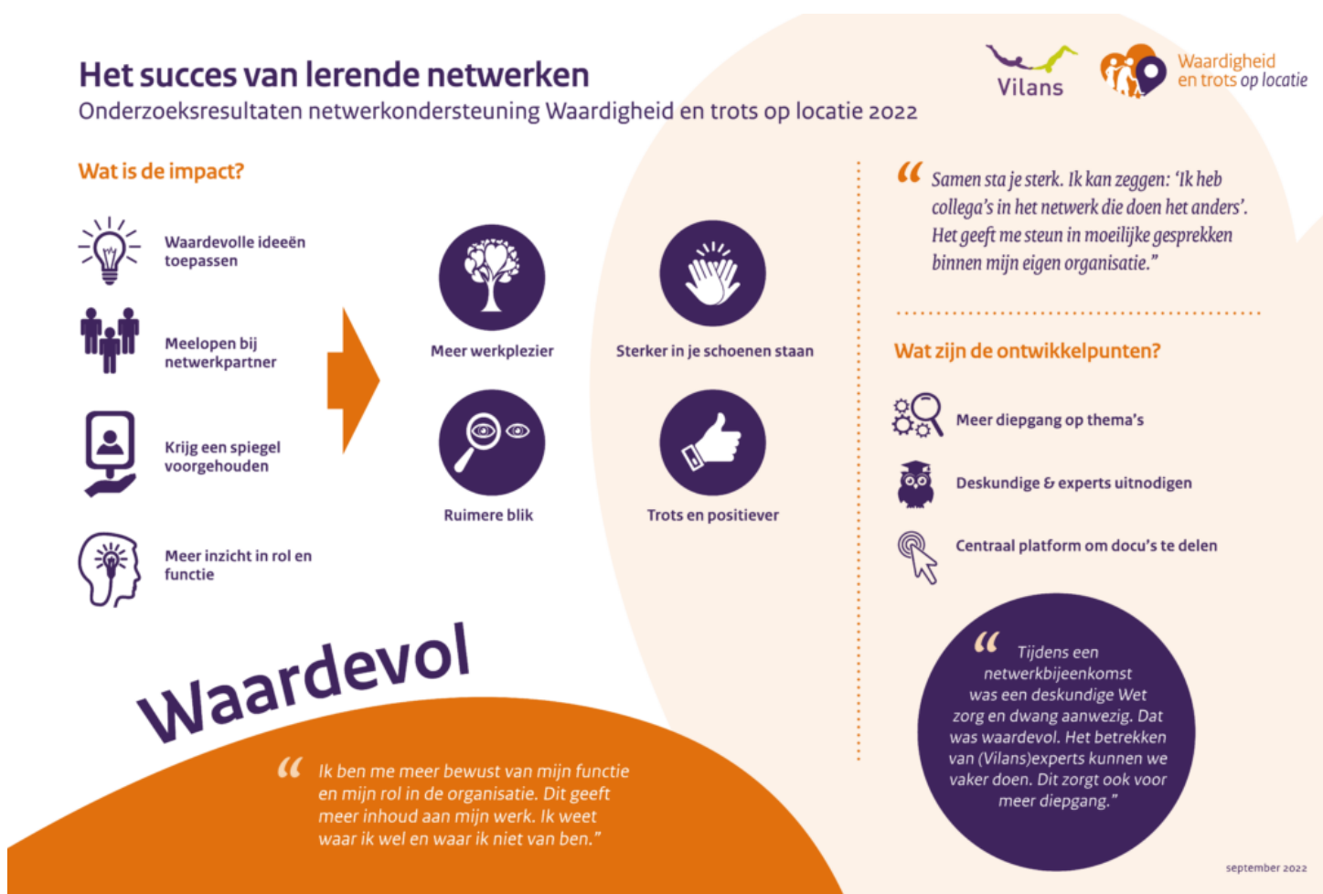
Infographic: Het succes van lerende netwerken

De professionals geven aan dat het goed werkt als een onafhankelijke externe partij de bijeenkomsten organiseert en faciliteert. Zo vertelt een deelnemer: 'Als we dit zelf zouden moeten doen, zou dit in de waan van de dag van ons drukke werk misschien snel stoppen.' En: 'De netwerkmanager kijkt verder dan het ene netwerk en verbindt dingen met elkaar.' Andere behoeftes voor de toekomst zijn een afwisseling van fysieke en online bijeenkomsten en een duidelijke jaarplanning en taakverdeling.