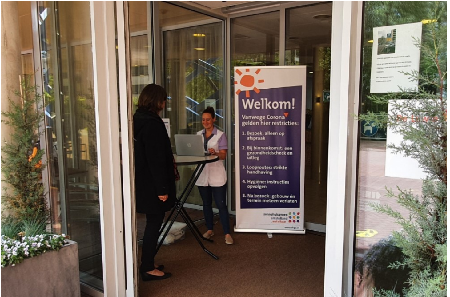
Ontvangst van bezoek bij Zonnehuisgroep Amstelland