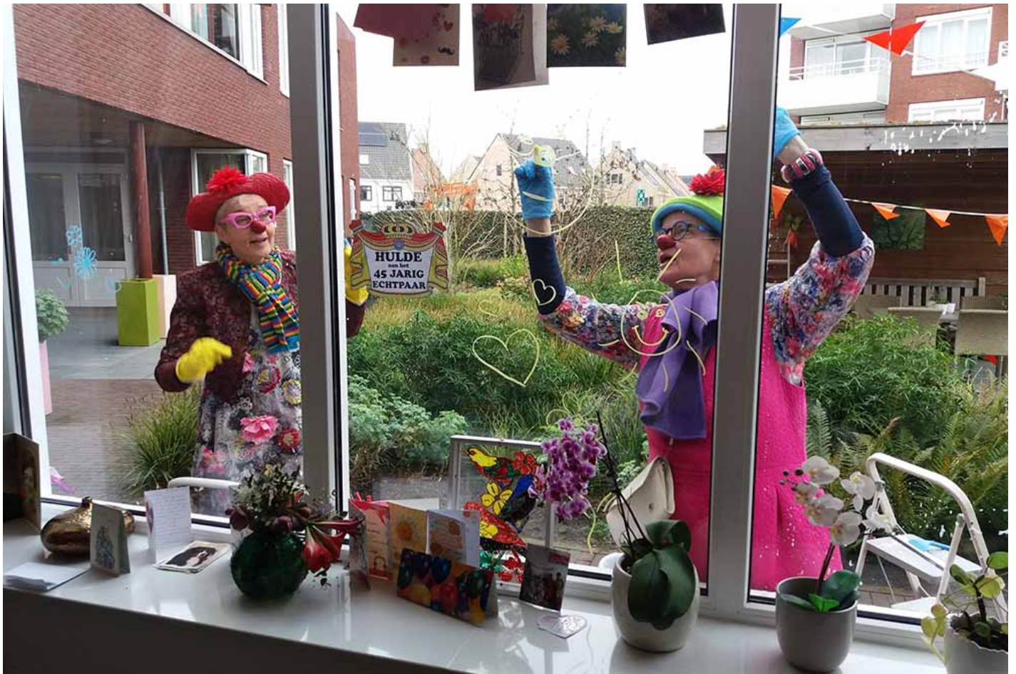
Cleaning clowns in actie